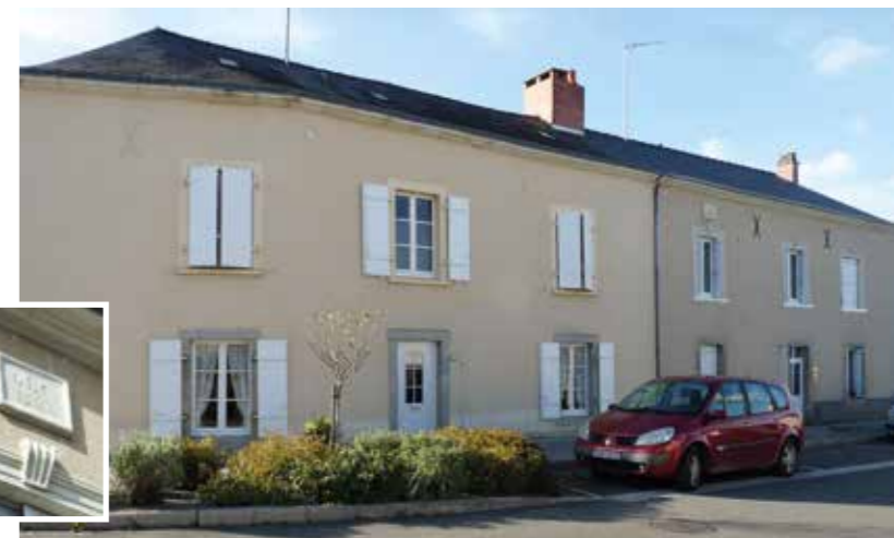
Gendarmerie rue d'Anjou et ci-dessous ses écuries dans la cour arrière

Pour le nouvel emplacement, un logement construit récemment (1852) suite à l'alignement de la route, situé aux n°171 et 182, rue d'Anjou, appartenant à M. Leclerc, est retenu, à condition de construire l'écurie et les annexes, dans la cour arrière. Les militaires auront résidé dans ce lieu pendant presque un siècle.