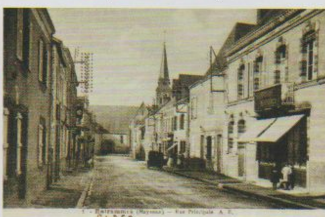
Remarquer l'évolution à l'arrivée de l'électricité dans le village vers 1930.