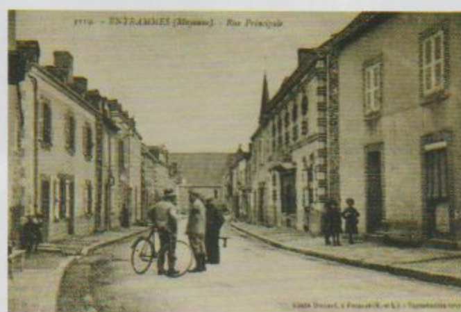
L'épicerie à droite dans la rue Principale au début du XX e siècle (sans électricité)